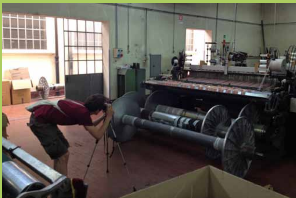
"Alcuni momenti del workshop"

Io credo si renda quanto mai indispensabile l'adozione di criteri condivisi nella gestione del territorio, per conservarne le caratteristiche e migliorarne la fruizione sia da parte degli operatori economici, sia da parte di residenti e turisti. Sarebbe altresì auspicabile una programmazione degli eventi condivisa tra istituzioni ed Associazioni, per conseguire economie di scala ottimizzando le poche risorse disponibili, e nel contempo per crescere a livello qualitativo e intercettare un pubblico diversificato per esigenze ed aspettative. Sono tuttavia fiducioso, perché il fattore che può fare la differenza è la laboriosità e l'impegno che da sempre ci contraddistinguono; prova ne è la ricchezza di manifestazioni che nel corso degli anni si sono affermate quali appuntamenti fissi nel nostro territorio grazie alle sinergie messe in campo fra Pro Loco, Associazioni e Istituzioni. Mi preme qui ricordare che tanto si deve ai volontari, cittadini che generosamente mettono il loro tempo e il loro lavoro gratuitamente a favore della comunità. In particolare, colgo l'occasione per ringraziare tutti i cisonesi e non, che a vario titolo concorrono all'organizzazione di ArtigianatoVivo, un fiore all'occhiello per il nostro territorio, giunto quest'anno alla 33ª edizione.