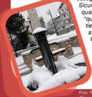
Foto: Fontana di Vergoman con Chiesa di Sant'Antonio Abate

Sicuramente la comunità del paese più alto non si fa onore in quanto onestà e tra le Ville circostanti era conosciuta come "quei che vol esser sempre par sora come l'oiò" e "quei che tien al codice sot la napa". In ogni caso, meglio non aver nulla a che fare. Anche tra Gai e Tovenà esisteva una simile tenzone. Gai era preso in giro per il suo campanile piccolo, tant'è che una notte fu scaricato davanti al portale del medesimo un carro di letame "parchè al posse crescer". E ancora il motto: "I sona a Gai e i bala a Tovenà", per indicare che il suono delle campane di San Michele si udiva meglio a Tovenà che a Gai...