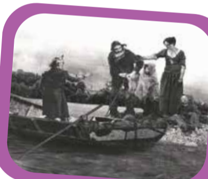
Nella foto: "Signor da Vidor, ciolè la barca e vegnème cior". È un particolare dell'opera pittorica della facciata esterna del Centro Polifunzionale di Vidor - Autore Aldo Rebull, settembre 2011.